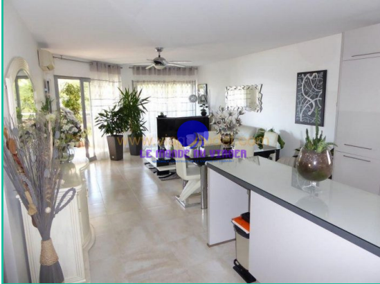
Coup de cœur